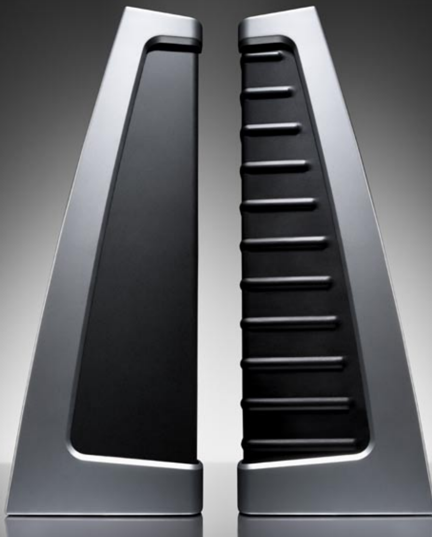
Flextight X1 e Flextight X5